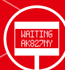
TABELLONE PER MESSAGGISTICA