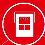
TERMINALE DI PESATURA