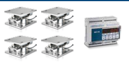
KIT DI PESATURA SPECIFICI