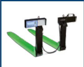
BILANCE PER CARRELLI ELEVATORI