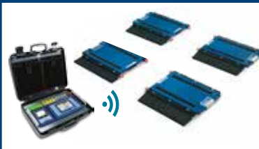
BILANCE PER PESATURA E CONTROLLO VEICOLI