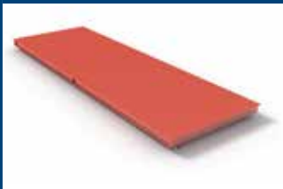
PESE A PONTE ELETTRONICHE MODULARI