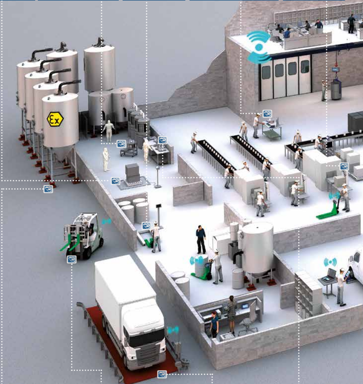
KIT DI PESATURA SPECIFICI