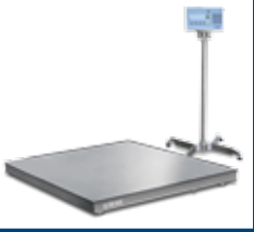
BILANCE DA PAVIMENTO